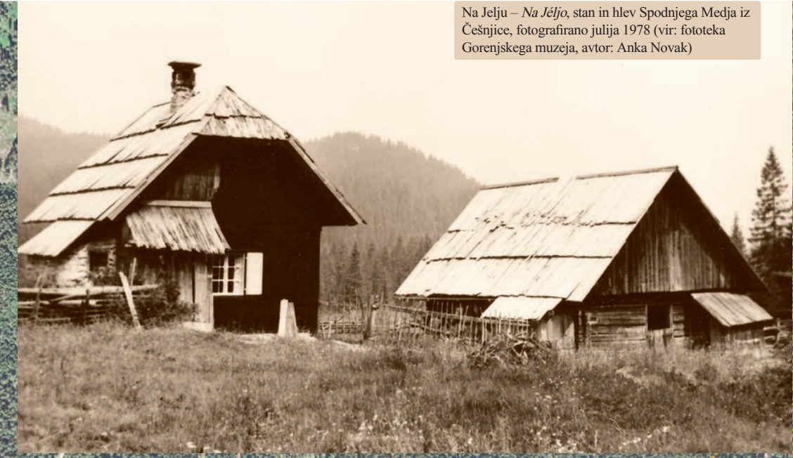
Na Jelu – Na Aljov stani in hlev Spodnjega Medja iz Čeljence, fotografirano julija 1978