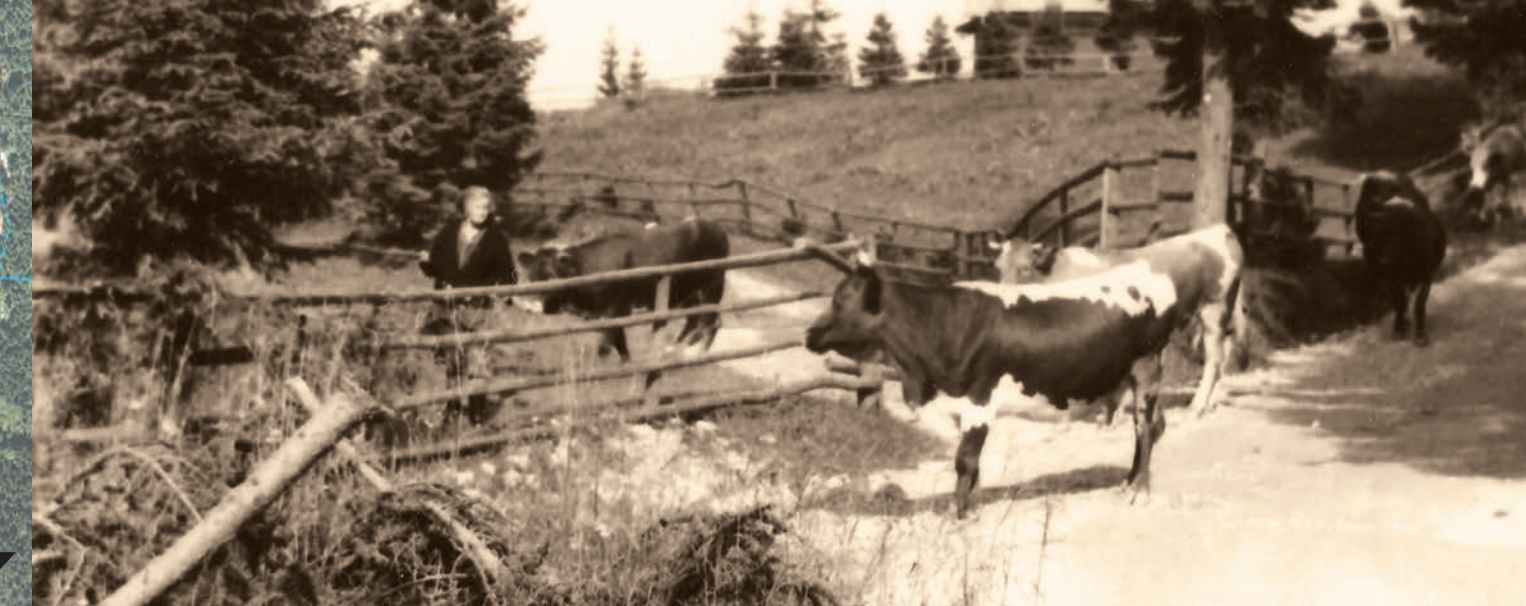
Goreljak – Goreljak, živina se vrata s pasc, fotografirano julija leta 1978