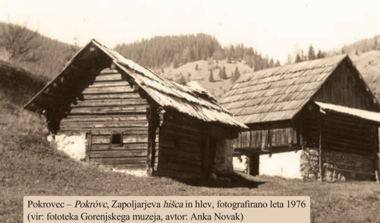
Pokrovec — Pokrovec, Zapoljarjeva hiša in hlev, fotografirano leta 1976

Zapis ledinskih imen Za jezikoslovno obravnavo domačih, tj. narečnih ledinskih in bišnih imen je najpomembnejši natančen fonetični zapis njihovega narečnega izgovora z naglasom vred, kar skupaj z zgodovinskimi viri in morebitnimi pojasnili domačinov omogoča pravilno poknjžitev in razlago vsakega imena. Za jezikoslovno predstavitve pa se lahko uporabi t. i. poenostavljeni narečni zapis, tj. zapis narečja s črkami knjižne abecede in znakom za polglasnik ter z oznako jakostnega naglasa (za mesto naglasa ter dolžino in kakovost naglasenih samoglasnikov), medtem ko se omenili samoglasnikov ne piše ali kako drugače označuje. Na primer: polglasnik, kot se v slovenskem knjižnem jeziku izgovarja v besedi 'pes', se zapiše z znakom o (torej paš , če je kratko naglasen, tápa 'trta', če je dolgo naglasen, in petak 'petek', če ni naglasen), strešica na e in o pomeni njun široki in dolgi izgovor (slov. knj. kóza , séstra ), ostrišica nad meta dvema črkama pomeni, da se izgovarjata dolgo in ozko (slov. knj. zvézda , mísi ), medtem ko ostrišica na črkah a , u in o označuje le njihovo dolžino (slov. knj. gláva , múha , híša ). Kratice vedno označuje kratak izgovor naglasnega samoglasnika (slov. knj. brát , míš , kúp , kmét , króp ).