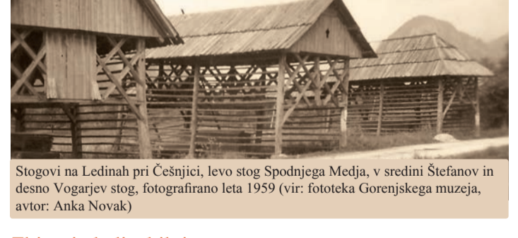
Stogovi na Lednab pri Češnji, levo stog Spodnjega Medja, v sredini Štefanov in demno Vogarjev stog, fotografirano leta 1959

Ledinska imena Ledinska imena poimenujejo najmanjše geografske enote: gore, vrhove, doline, pobočja, gozdove, travnike, polja, poti, močvirja in drugo. Ledinska imena so ljudem nekoč služila za orientacijo v njihovem bližnjem življenjskem okolju in pri njihovih kmetijskih opravilih, danes so pomembna kot orientacijske točke. Starost ledinskih imen je različna, nekatera segajo v začetke poselitve, druga pa so mlajša. Ledinska imena so zrcalo zgodovinskega in jezikovnega razvoja pokrajine. V domači krajevni narečni govorici so se prenašala iz roda v rod, spreminjala pa se je način njihove izgovarjave in zapisa.